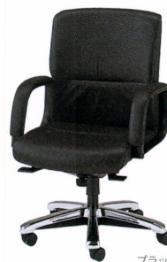
TXQ-6KN 本革 ¥246,800* 質量:24.3kg