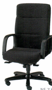
TXQ-T8 布 ¥157,800* TXQ-T8L レザー ¥157,800* 質量:23.7kg