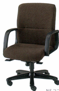
TXQ-T6 布 ¥149,300* TXQ-T6L レザー ¥149,300* 質量:23.0kg