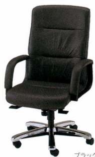
TXQ-8KN 本革 ¥258,400* 質量:25.1kg