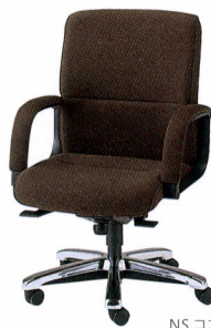
TXQ-6 布 ¥159,300* TXQ-6L レザー ¥159,300* 質量:23.0kg