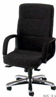
TXQ-8 布 ¥167,800* TXQ-8L レザー ¥167,800* 質量:23.7kg