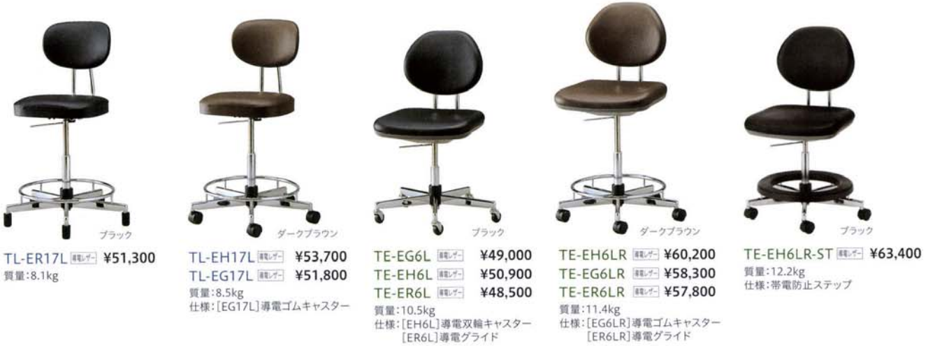
TL-ER17L 黒色 ¥51,300 質量:8.1kg