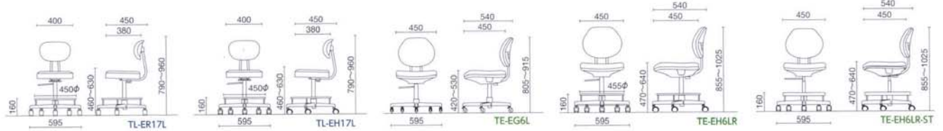
TE-EH6LR-ST 黒色 ¥63,400 質量:12.2kg 仕様:帯電防止ステップ