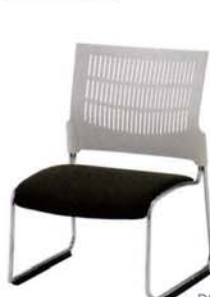
DS-33WC-TT AK ダークグレー