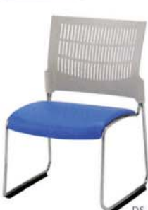
DS-38WL-TT AL ブルー