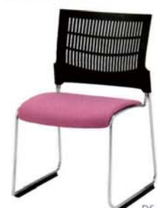
DS-43BC-TT AK ピンクローズ